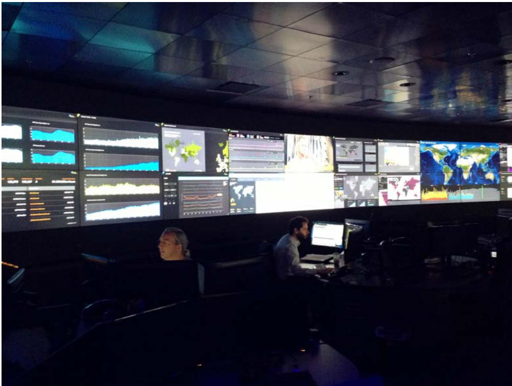
Kontrollrummet hos Akamai Technologies där en stor andel av all världens internettrafik hanteras.