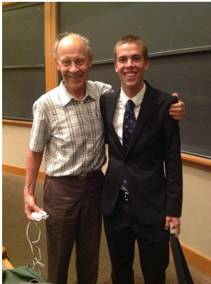
Jag och Nobelpristagaren i kemi 1986, Dudley Herschbach.

Under dessa sex veckor så var den första en introduktionsvecka med en massa lektioner och workshops för att vara väl förberedda för de dryga fyra veckor av forskning som följde. De flesta kvällar var det föreläsningar i ett klassrum på MIT. Föreläsarna kom från bland annat Department of Defense och tre stycken var till och med Nobelpristagare. Det mest minnesvärda ögonblicket var nog när hela 40 personer, inklusive jag, gick upp och kramade Dudley Herschbach, Nobelpristagare i kemi 1986. Vi fick även besöka Akamai Technologies som hanterar stora delar av världens internettrafik och som ser till att bland annat alla FaceTime-samtal fungerar.